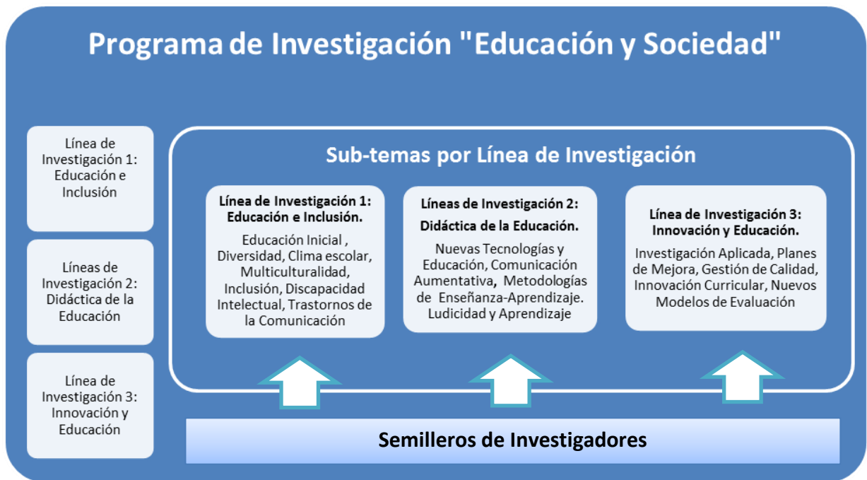
Fig. 1. Esquema del Programa de Investigación “Educación y Sociedad”

Éstas han sido definidas en función las áreas abordadas por la Universidad en el ámbito de la Pedagogía, así como por las líneas de investigación desarrolladas por cada una de las facultades de la Universidad en el contexto del proyecto universitario, y se ven reflejadas en el conjunto de sub-temas se detallan en la Figura 1, a continuación: